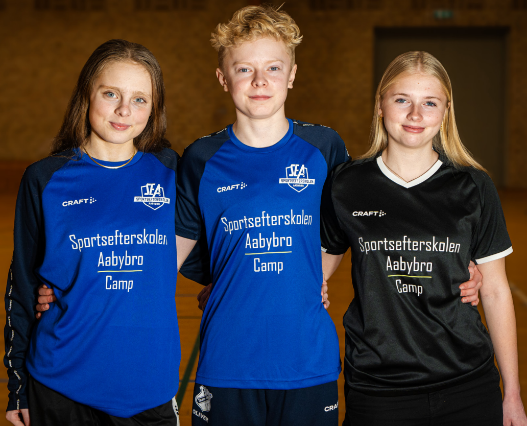
Billede af camptøj

Vi glæder os helt vildt til en fantastisk uge, med en masse oplevelser og smil. De bedste hilsner et spændt instruktørteam.